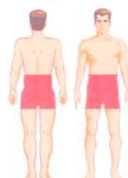
نمونه برداری پروستات