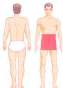
نمونه برداری از بیضه