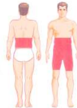
عمل سنگ کلیه