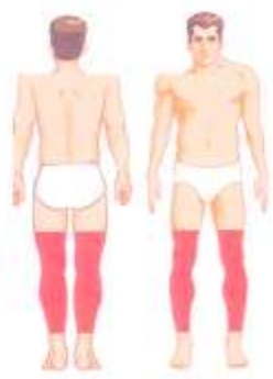
عمل آرتروسکوپی زانو