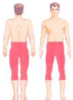
عمل شکستی ران