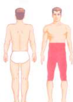
عمل پروستات و مثانه